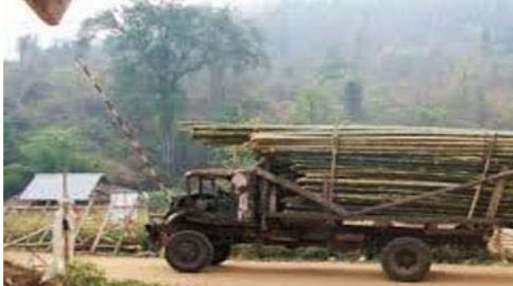
လားရှိုးသစ်တောဝန်ထမ်းများ အဆမတန်အခွန်ကောက်နေ

အများအားဖြင့် တင်ဆောင်လာသော တောထွက်ပစ္စည်းများမှာ မီးသွေး၊ ထင်း၊ မျှော်တိုင်၊ ခြံတိုင်၊ အိမ်တိုင်၊ ဝါးလုံး၊ သက်ကယ်များဖြစ်ကြပြီး ဒေသခံများ ရဲ့ စားဝတ်နေရေးအတွက် မရှိမဖြစ်သော လိုအပ်ချက်များ ဖြစ်ပြီး ယခုလို အဆမတန် အခွန်တွေကောက်နေခြင်းမှာ ဒေသခံများအတွက်အခက်အခဲဖြစ်သလို၊ ထော်လဂျီနှင့်ကားသမား များအတွက်လည်း အလုပ်အကိုင်အခက်အခဲ ဖြစ်နေကြကြောင်း သိရသည်။